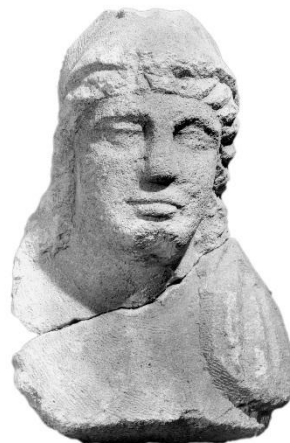
Büste des Mars Latobius – des zweiten einheimisch-römischen Gottes, der hier verehrt wurde