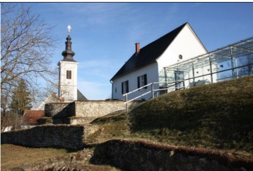
Tempelbezirk mit dem Fundament des Isistempels vorne und der barocken Wallfahrtskirche im Hintergrund

Die Neufunde sowie der neu entdeckte Bau bringen bedeutende neue Erkenntnisse in die Frage nach dem Frauenberger „Tempelberg“, der altes keltisches Stammeszentrum und kultischer Mittelpunkt der Region war. Bereits in der frühen römischen Kaiserzeit verschmolzen hier römische und einheimische Elemente miteinander, bevor das Heiligtum Wallfahrtszentrum wurde. In der Spätantike wurden die Tempel abgerissen und eine erste frühchristliche Kirche errichtet. Im Zuge der Grabungen der Jahre 2008 bis 2012 wurden zahlreiche Reste deren marmornen Inneneinrichtung entdeckt, wodurch sich das Wissen um diese frühchristliche Periode erhärtet hat.